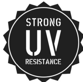
HAUTE RÉISTANCE AUX UV ET AUX INTEMPÉRIES 6 selon norme NF EN ISO 105 - B02 & B04 Strong UV and bad weather resistance. Hohe UV- und Wetterbeständigkeit. Altamente resistente a los UV y a las inclemencias climáticas. Alta resistenza agli UV ed intemperie.