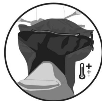
POLAIRE MATELASSÉE. Padded fleece. Gepolsterter Fleece. Polar alcohado. Pile trapunto.