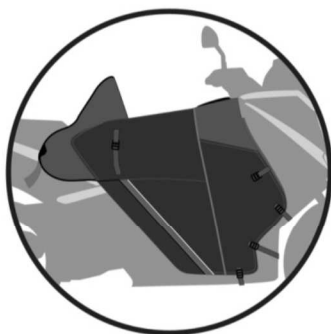
PROTECTION ET MAINTIEN DU TABLIER Gives protection and holds the apron in place Schutz und Bewahrung der Beindecke Protección y porte del delantal Protezione e mantenimento del coprigambe