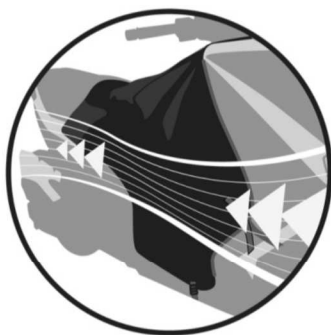
RIGIDIFICATEUR AÉRODYNAMIQUE Aerodynamic strengthener. Aerodynamischer und steiferer Teil. Estabilizadores aerodinámicos. Rigidificatore aerodinamico.