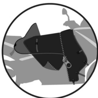
DÉZIPPABLE The two parts are separable with the zip Diese 2 Teile sind durch den Reißverschluss trennbar Cremallera para separar las dos partes Separazione delle due parte per un zip