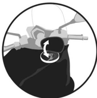
TRAPPE Trap door. Klappe. Tapa. Chiusura.