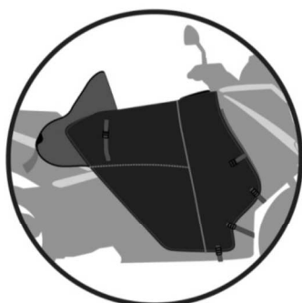
MODE HIVER Winter version Sommer Ausführung Versión invierno Versione inverno