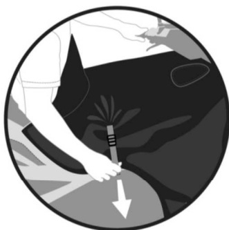
SANGLE D'AJUSTEMENT. Adjustable strap. Befestigungsgurt. Cinghia di adeguamento. Cinghia di adeguamento.