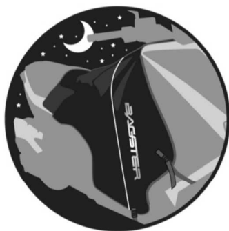
RETROREFLÉCHISSANT Retro reflecting. Reflektierende. Estabilizadores aerodinámicos. Retro riflettente.