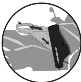
MODE ÉTÉ Summer version Winter Ausführung Versión verano Versione estate