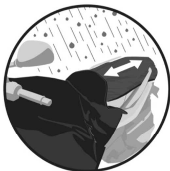
COUVRE-SELLE RÉGLABLE Adjustable cover for seat. Verstellbarer Sitzbanküberzug. Funda de asiento regulable. Coprisedella regolabile.