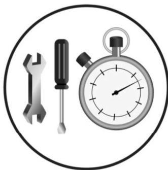
MONTAGE SIMPLE ET RAPIDE Quick fitting. Schnelle Montage. Montaje rápido. Montaggio rapido.